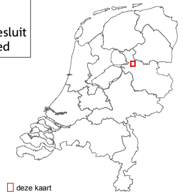
■ deze kaart

Bestaande bebouwing, erven, tuinen, verhardingen en hoofdspoorwegen maken geen deel uit van het aangewezen gebied, tenzij expliciet wel bij de aanwijzing betrokken, zie verder nota van toelichting bij het besluit.